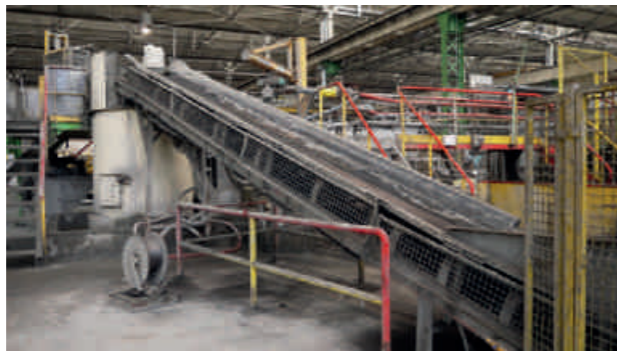
Ciments Renforcés Industries 2014

Après de telles journées, vers minuit, elle passe en pilotage automatique. Le sommeil l'emporte & fait remonter à la surface les questions de fond : quelle orientation donner à l'ensemble du travail ? Quelle destination réserver à ces objets qu'elle a détournés de leurs buts, en déshérence désormais ? Comme il lui est facile en position allongée, quand elle est dans la lune ou la tête dans les étoiles, de mélanger les activités, les formes & les couleurs ! Qui deviennent ses tubes de peintures contenant tous les tableaux possibles, une solution tubulaire... Rêves extirpés