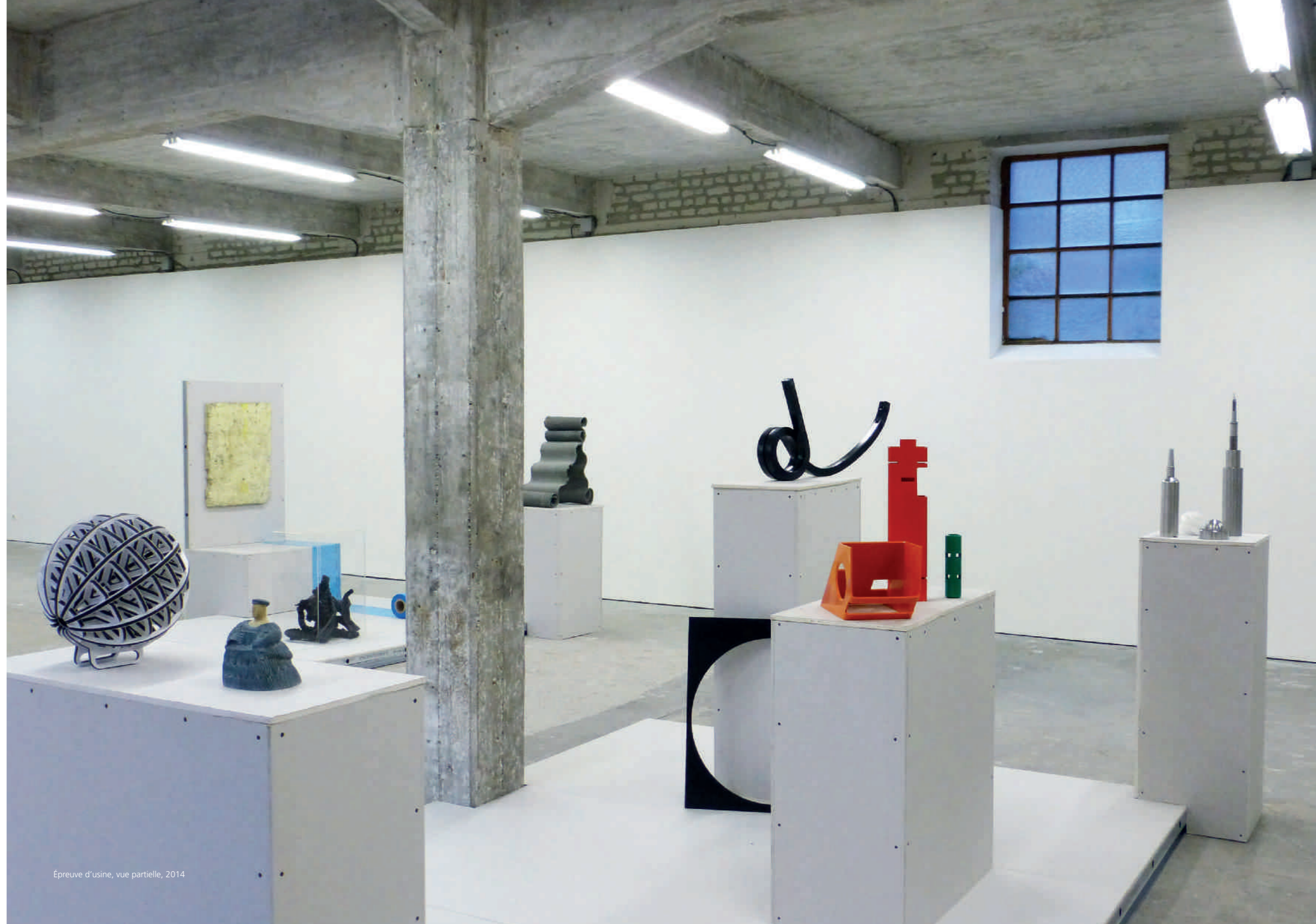
Épreuve d'usine, vue partielle, 2014