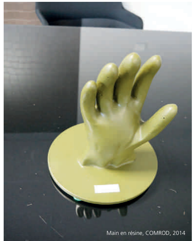
Main en résine, COMROD, 2014

Cette exposition est un tour d'horizon du travail de 20 usines + 1 statuette – 2000 avant J.C.