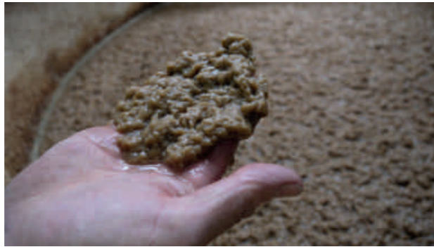
Ciments Renforcés Industries 2014

N'hésitant pas à transgresser les catégories, elle ira jusqu'à inviter ses nouveaux partenaires à participer au projet artistique par une fabrication spéciale. Le Lumix – CLIC ! – capture l'instant d'avant toute chose... pour compléter le catalogue.