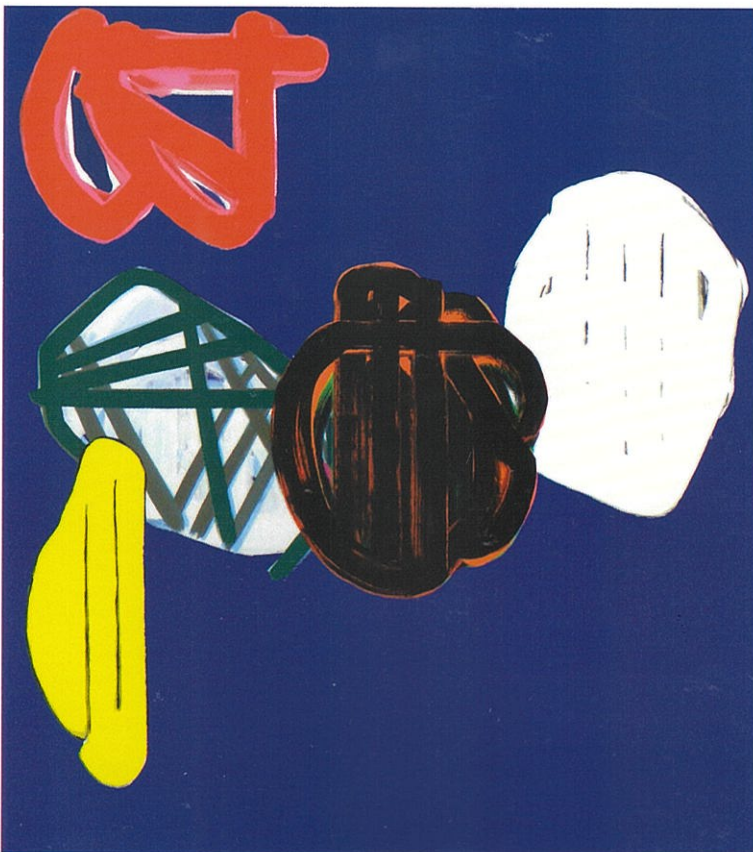
Bleu cobalt, acrylique sur toile, 170 x 150 cm, 2009

une fin en soi, mais la formation d'une limite à partir de laquelle le tableau peut commencer à exister, une limite comme seuil. « La limite n'est pas ce où quelque chose cesse, mais bien [...] ce à partir de quoi quelque chose commence à être » souligne Heidegger.