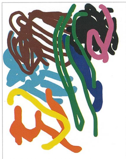
Blanc, acrylique sur toile, 117 x 145 cm, 2005