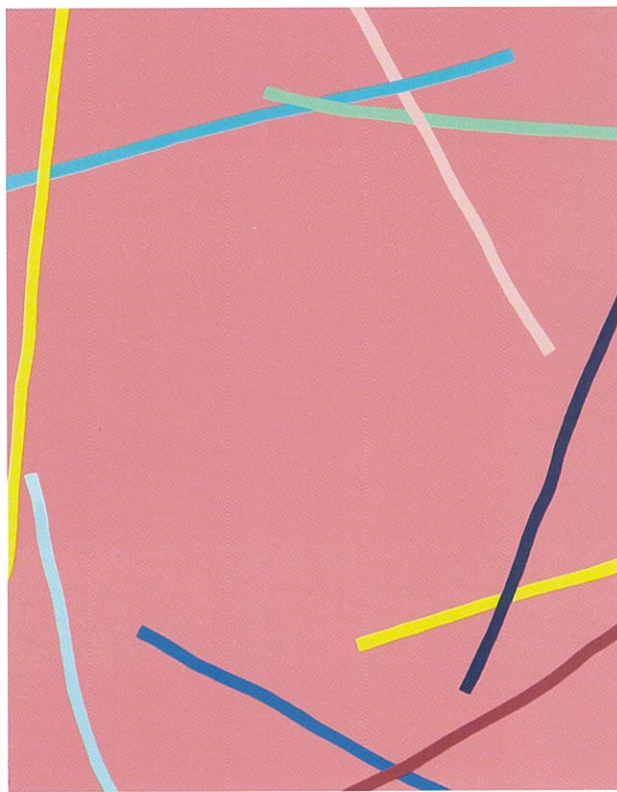
Rose saumon, acrylique sur toile, 162 x 130 cm, 2001